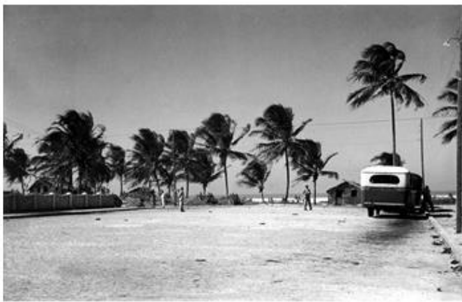
Avenida Barão de Studart (1938)

08. As duas imagens mostram a mesma avenida em duas épocas diferentes. Observe as imagens e responda aos itens.