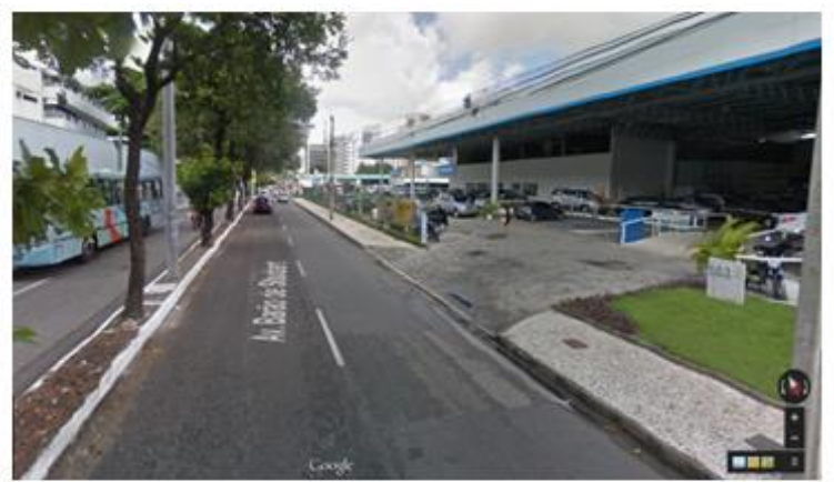
Avenida Barão de Studart (2014)

a) Escreva duas transformações ocorridas na avenida entre os anos de 1938 e 2014.